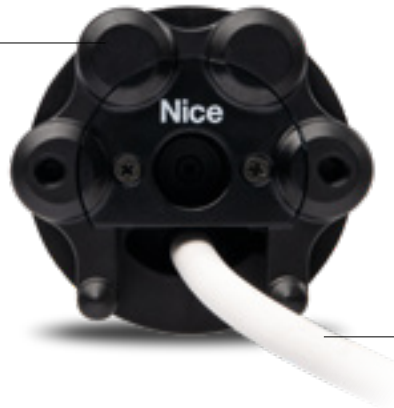
Cable de alimentación práctico y extraíble

Cabeza del motor tubular compatible con los soportes en forma de estrella.